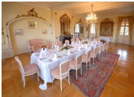
Salon für max. 45 Gäste