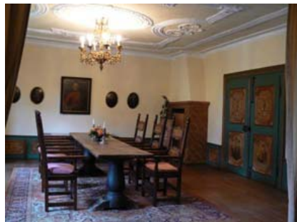
Herrencabinet für max. 25 Gäste