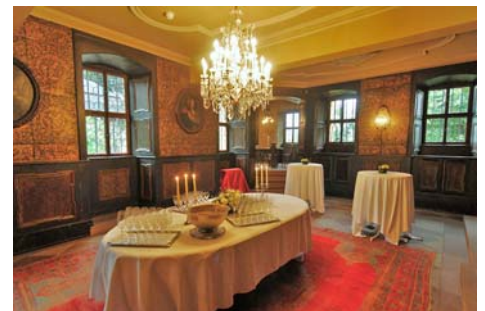
Ledertapetenzimmer für max. 60 Gäste