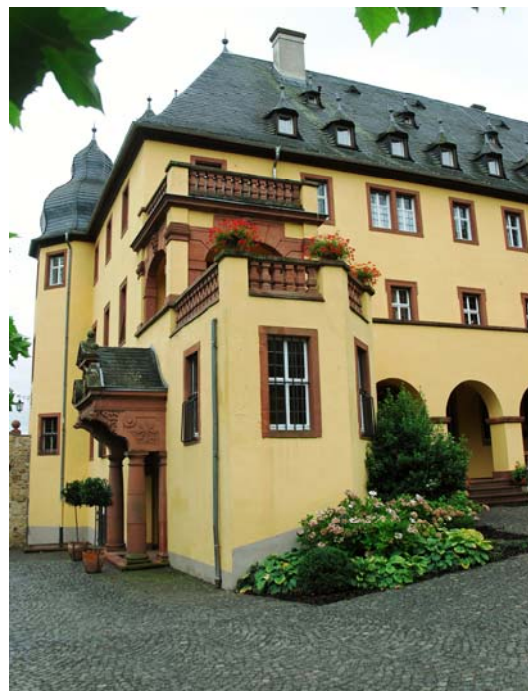
Herrenhaus auf Schloss Vollrads