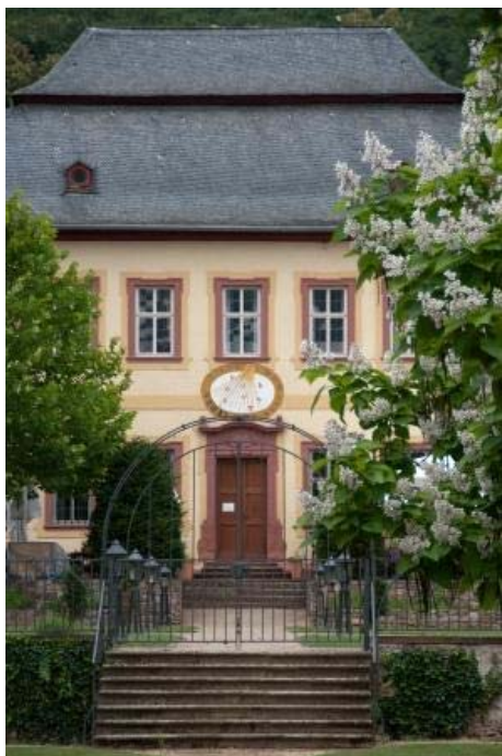
Gutsrestaurant Schloss Vollrads

Ihr Veranstaltungsteam von Schloss Vollrads