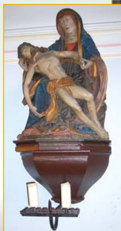
Piäta in der Schlosskapelle (unrestauriert)