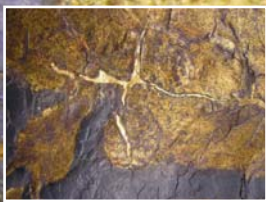
Fehlstelle mit eingesetzter Goldlederintarsie (B = 1,5 mm)

links: Goldledertapetenbahn nach der Restaurierung unten: Vorzustand – aufgeplatzte Naht im oberen Friesbereich