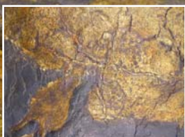
Goldlederintarsie nach der Retusche