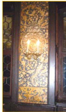
Ausschnitt Ledertapete im „Leuertapetenzimmer“ von Schloss Vollrads

gen, zu sichern und zu konservieren. Für eine spätere Präsentation dieses wertvollen Einzelstücks wird ein Untergestell anzufertigen und eine klimatisierte Vitrine zu bauen sein.